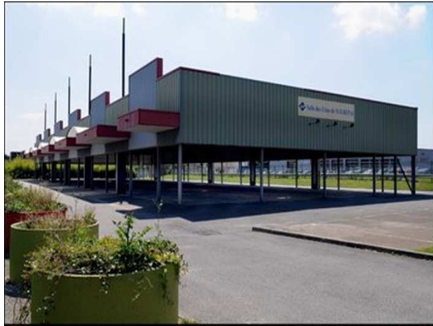
MAUREPAS – Salle des Fêtes - feuille 1