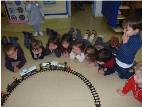
Noël en 2/4 ans

Nous remercions les parents pour l'organisation des douceurs du goûter de Noël. Les enfants et l'équipe se sont encore une fois très bien régalez.