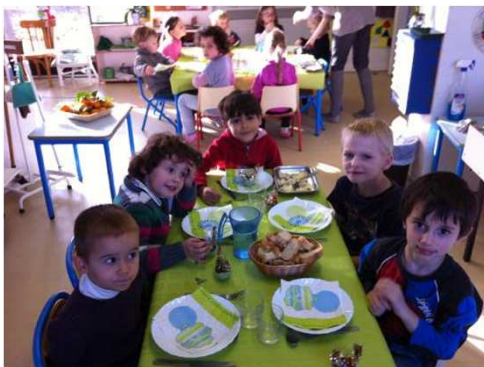
Le repas de Noël en 3/6 ans

Au lever de sieste, les enfants ont eu la joie de découvrir les cadeaux au pied du sapin. Des peluches et de la pâte à modeler ont fait le bonheur des uns et des autres.